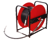
ホースドラム (セット30Dのみ)