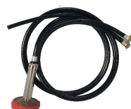
ツイン吸余水ホース+ おもしフィルタ+吸水フィルタ