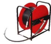
ホースドラム (セット30Dのみ)