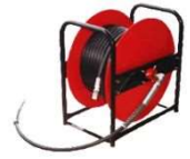
ホースドラム (セット30Dのみ)