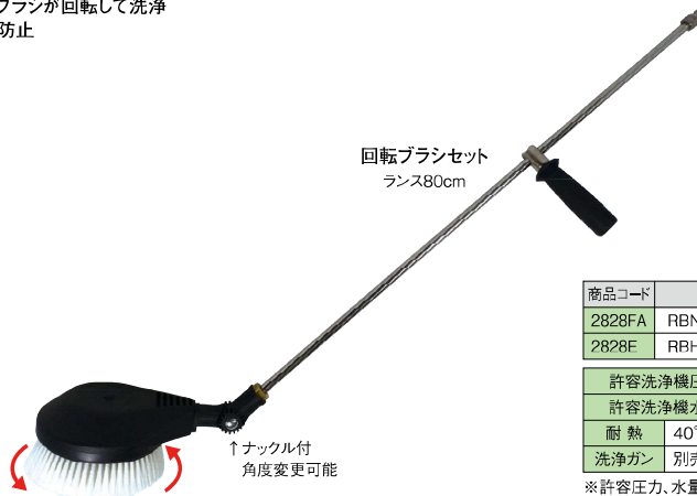
回転ブラシセット ランス80cm