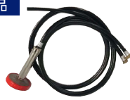
ツイン吸水ホース+おもしフィルター+吸水フィルター