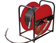
ホースドラム(30Dのみ)