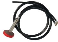
ツイン吸水ホース+おもしフィルター+吸水フィルター