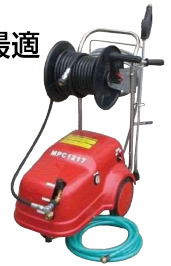
ホースドラム取付例(オプション)