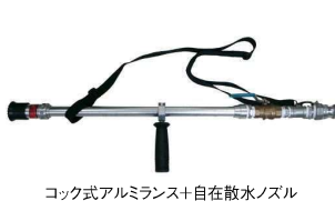
コック式アルミランス+自在散水ノズル