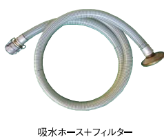
吸水ホース+フィルター