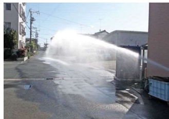
<VJ/WJの解体現場の防塵作業>