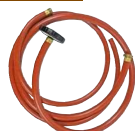
吸水水ホース+吸水フィルター