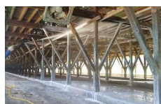
鶏舎での石灰散布