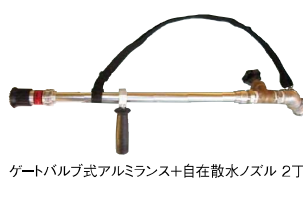
ゲートバルブ式アルミランス+自在散水ノズル 2丁