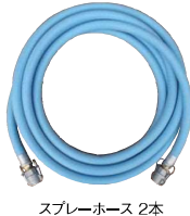
スプレーホース 2本