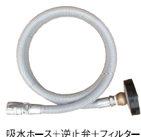
吸水ホース+逆止弁+フィルター