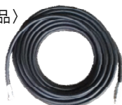
洗淨ホース10m・20mまたは30m